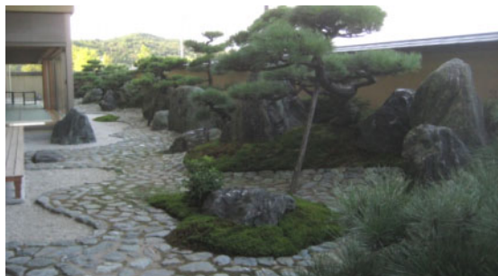
青と緑で構成した庭。(華鳳 別邸 越の里)