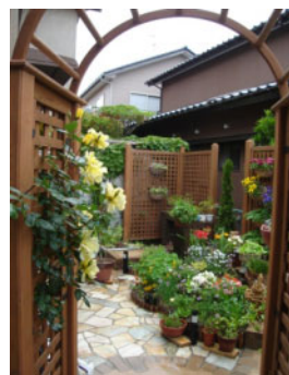
ツルバラや四季の花に囲まれたお庭の提案。