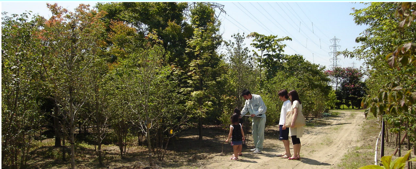
色々な樹種を見てみませんか？お客様と一緒に作り上げる「木もれ陽」をデザイン致します。