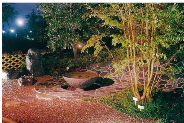
水のせせらぎと景石、雑木の「木もれ陽」の庭園。