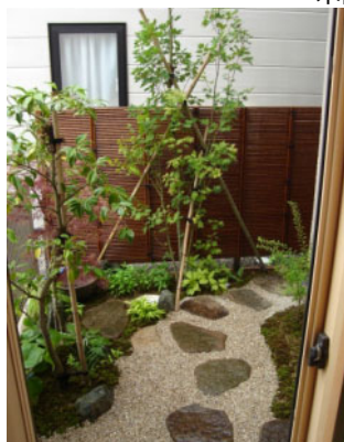
中庭の日陰にも樹木を提案。