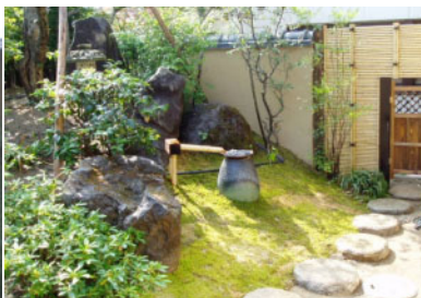
水琴窟の水音が響く庭。