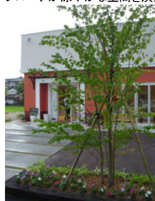
店舗前の広がり「木もれ陽」を。