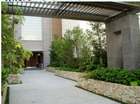
地元産の自然石による石積みと雑木の庭。(グランドメゾン西堀通りタワー)